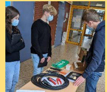
Berufs- und Studienorientierung