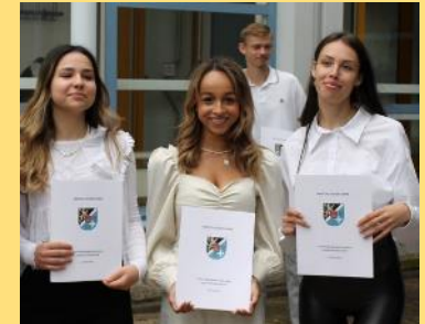
Fachoberschule Wirtschaft und Verwaltung