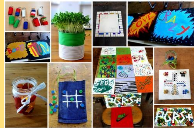
Arbeitsbeispiele aus dem Modul Kreatives Arbeiten